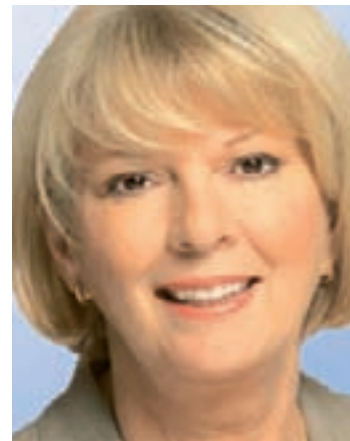
Rita Pawelski, MdB

„Unermüdlicher Einsatz für jeden einzelnen Bewohner“